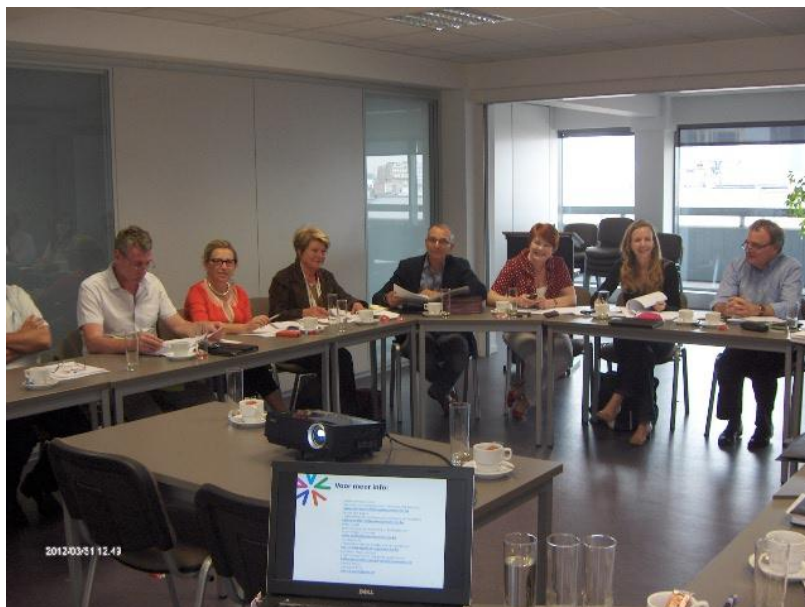
Raad van Bestuur