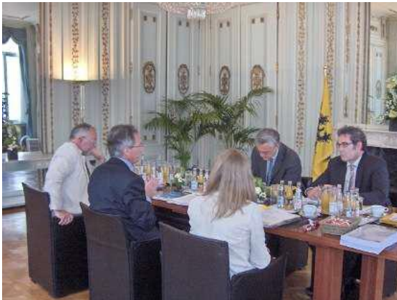
VVP-delegatie voerde onderhandelingen met de toenmalige formateur K. Peeters (2009)