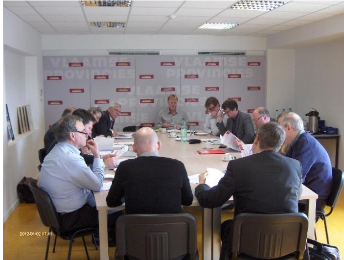
Gezamenlijke beleidscommissie Milieu en Ruimtelijke Ordening

Beide overlegmomenten leidden tot de afspraak dat op 21 januari 2013 een gezamenlijk overleg van beide ministers met de gedeputeerden verantwoordelijk voor Milieu en voor Ruimtelijke Ordening zal doorgaan.