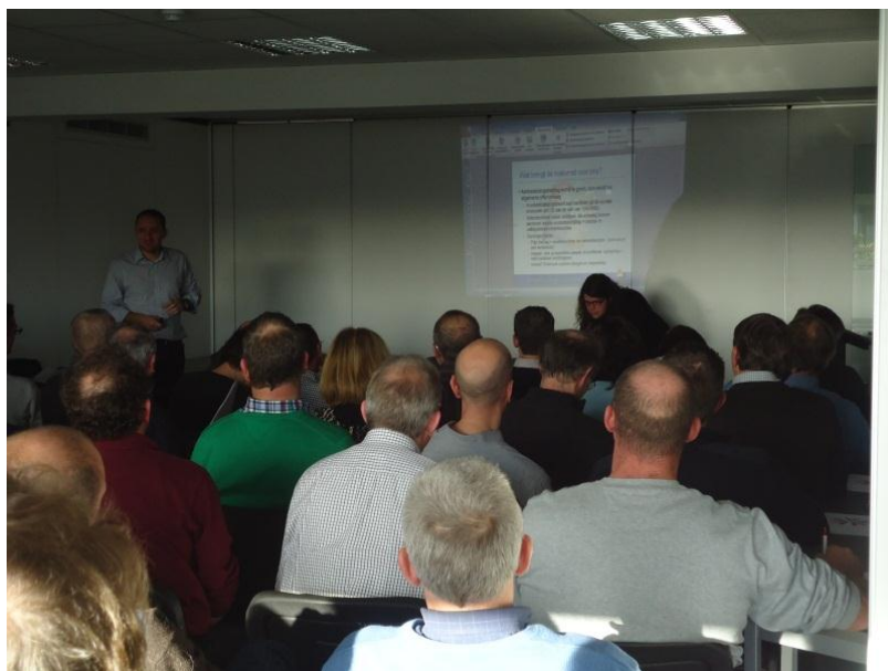
Vormingsdag met als thema “Onderhoud van onbevaarbare waterlopen”

Op 22 november werd door de a-commissie water een vormingsdag georganiseerd met als thema “Onderhoud van onbevaarbare waterlopen”. Naast de ervaringen van de verschillende provincies, kwam ook het onderhoud van waterlopen in Nederland aan bod en stelde het Agentschap Natuur en Bos de nieuwe code van goede natuurpraktijk voor.