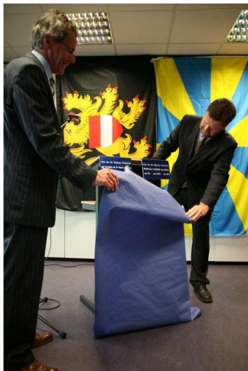
Officiële opening VVP-gebouw