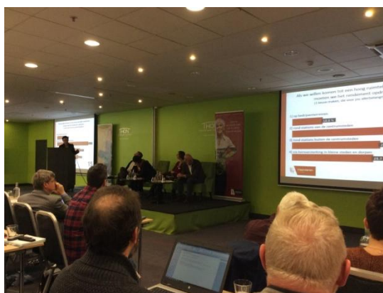
(BRV Partnerforum - 16 maart)

Op 6 maart hebben de VVP en de VVSG een gemeenschappelijk schrijven gericht aan minister Schauvliege met als doel het advies ‘Witboek BRV’ toe te lichten. Hierop werd positief gereageerd. Een overleg vond plaats op 12 mei. De VVP bracht naar aanleiding van het ontwerp van beleidskader ‘Bovenlokale Ontwikkeling’ een advies uit.