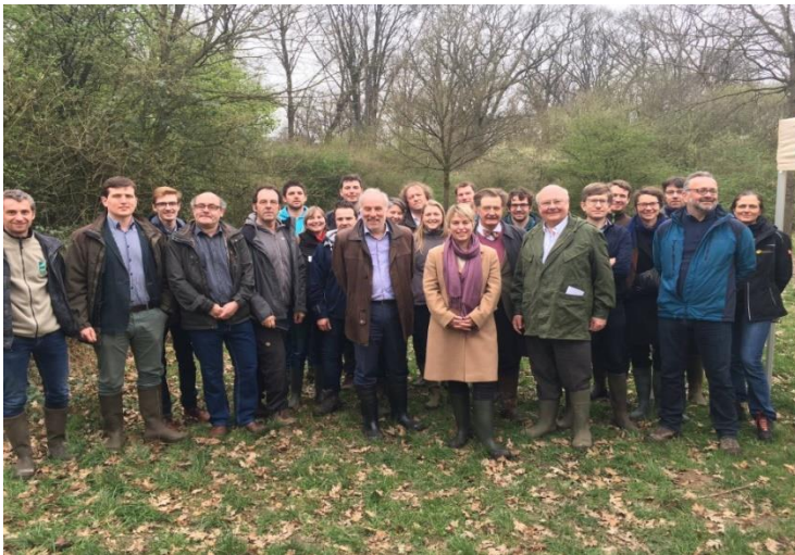
(Persmoment ondertekening samenwerkingsovereenkomst – 20 maart- provinciaal domein Gentbos)

Het agentschap voorziet jaarlijks voor de taken een budget van 1.365.000 euro. Deze overeenkomst werd begin 2017 door alle deputaties goedgekeurd. Op maandag 20 maart 2017 werd in het provinciaal domein Gentbos deze samenwerkingsovereenkomst plechtig ondertekend tussen Minister Joke Schauvliege en de bevoegde gedeputeerden leefmilieu van de 5 Vlaamse Provincies.