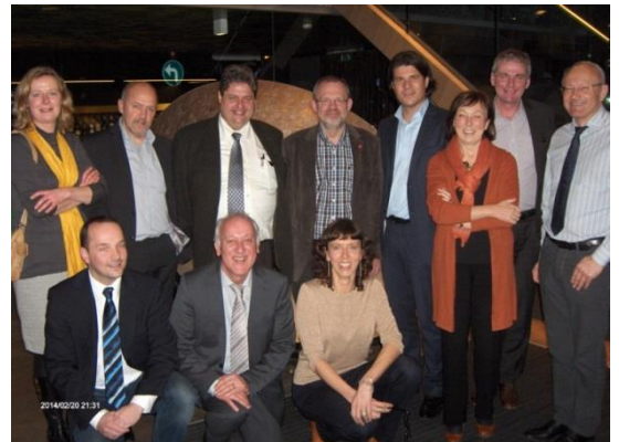
Beleidscommissie 20 februari: De gedeputeerden bevoegd voor toerisme, de PTO-directeurs en de LiV-directrice

Gedurende 2014 werd er door de PTO-directeurs meermaals gediscussieerd over het idee 'fietsvakanties'. Belangrijke aandachtspunten waren de onzekerheid over de productlijn 'fietsen' van Toerisme Vlaanderen (TVL) en de bijhorende productontwikkeling, namelijk fietsvakanties. Hierbij moet echter rekening gehouden worden met de taakverdeling inzake toerisme tussen de Vlaamse overheid en de provincies, en het feit dat de provincies niets moeten doen dat de private sector zelf kan/zal ondernemen. Gezien de standpunten van minister B. WEYTS over fietstoerisme in zijn beleidsnota, zal dit onderwerp ook in 2015 belangrijk blijven.