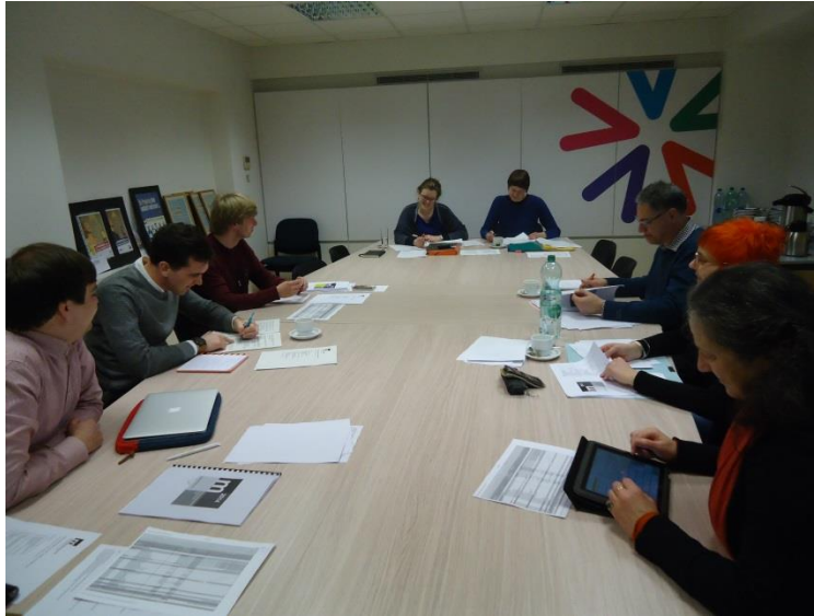
De nieuwe samenstelling van het Dagelijks Bestuur van Monumentenwacht Vlaanderen