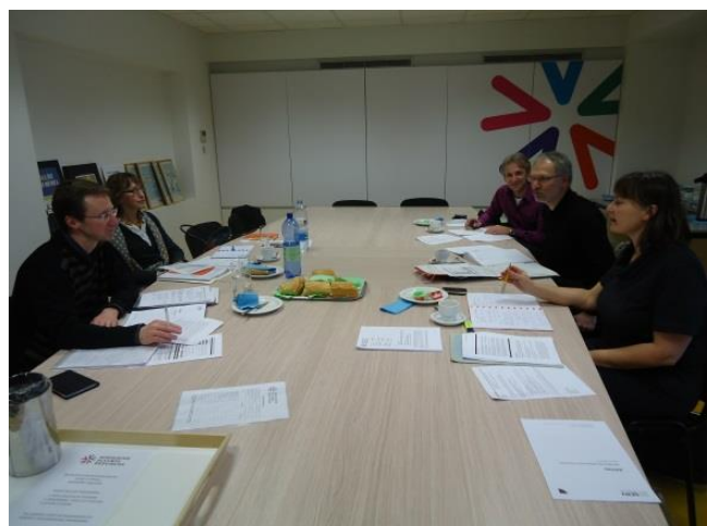
De a-commissie economie aan het werk

Van alle clusters in de verschillende provincies is de creacuster vaak de minst ontwikkelde/mature cluster. Daarom werd tijdens de a-commissie economie van februari 2014 voorgesteld dat hier eventueel een