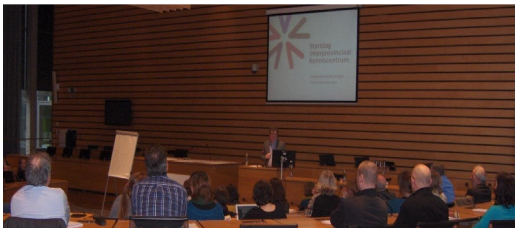
Startdag Interprovinciaal kenniscentrum milieu, 9 februari 2014, provinciehuis Leuven

Er werden door de Beleidscommissie Milieu 3 prioriteiten naar voor geschoven om intensiever samen te werken: Klimaat, Natuur en Milieuwetgeving.