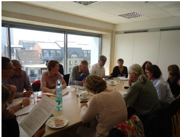
VVP – Task – Force Omgevingsvergunning

Op 6 juni 2014 keurde de Vlaamse regering een ontwerp van besluit bij dit decreet goed waarbij geen rekening werd gehouden met de door de gedeputeerden geformuleerde voorstellen.