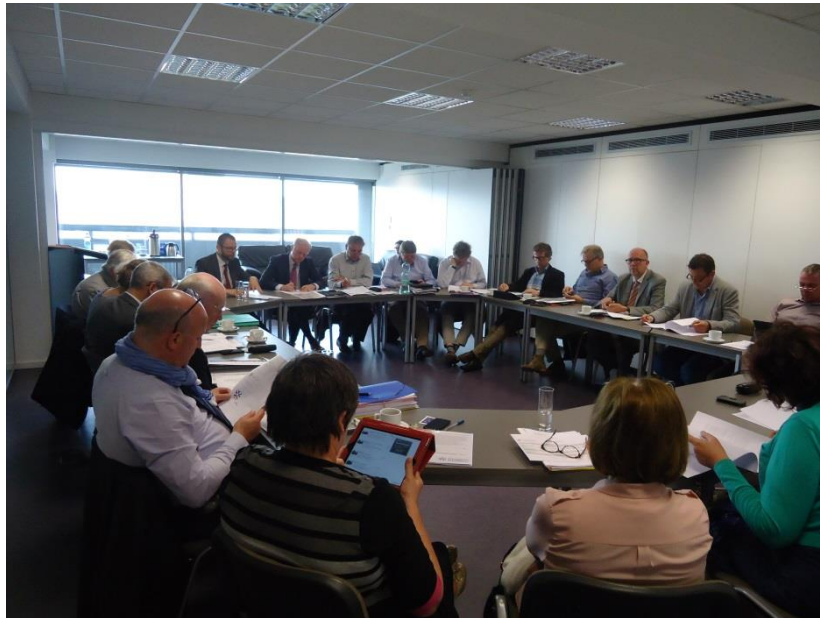
zitting van de Raad van Bestuur

20 januari; 17 februari, 28 april; 16 juni; 20 oktober en 17 november;