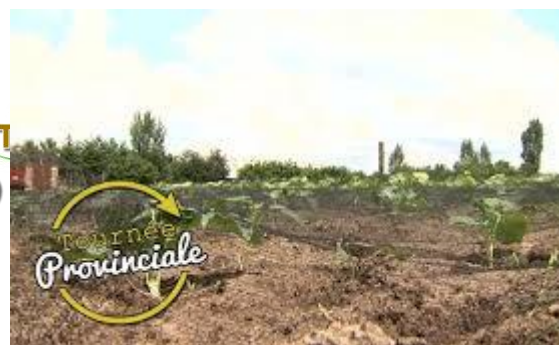
Logo's PlattelandsTV en Tournée Provinciale

Daarnaast kwamen de provincies ook gezamenlijk in beeld in de editie Land- en Tuinbouw die naar aanleiding van de Dag van de Landbouw als bijlage bij De Standaard werd uitgegeven. De